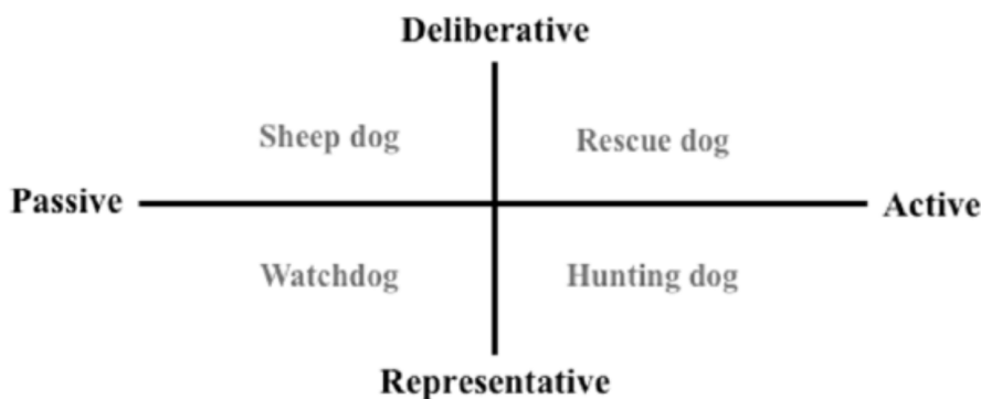
Figure 1. The journalistic compass (source: Peter, 2019: 514)

SoJo is theoretically most often considered from the normative perspective of the so-called journalistic compass founded by Peter Bro or the theory of framing by Robert Entman. “Solutions journalism is one example of the type of journalism where the reporter takes a more active role” (McIntyre, 2019, p. 20). Two sets of journalistic principles are presented in the compass (Figure 1). The first refers to the purpose of the journalistic profession, and according to this principle, journalists can take a passive role that involves reporting on existing problems, or an active role that involves monitoring the resolution of problems. In the second set of principles, we distinguish between the deliberative and representational models. In the representative, journalists focus on reporting on public and influential figures, representatives of authorities, organizations. In the deliberative model, journalists are focused on reporting on citizens. SoJo is an active problem reporting service with argumentative examples of functional solutions offered, focused on both citizens and decision-makers. Youth reporting can also be positioned in one of the above ways – passive or active, focusing on official sources (representative) or on (young) citizens (deliberative).